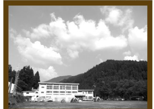
上味見生涯教育施設